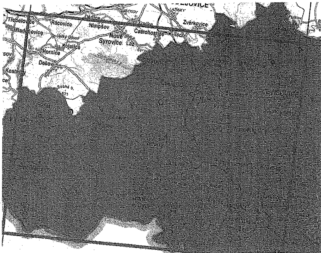
Příloha 1: Znoľmo 33-22 Vyznačené území aktualizace ZABAGED®